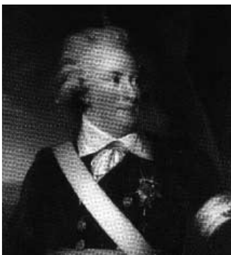
Portätt av kung Gustav III målat, av C.F. von Breda. Tavlan hänger på Åminne gård och sägs vara en gåva av Alexander I till Gustav Mauritz Armfelt.